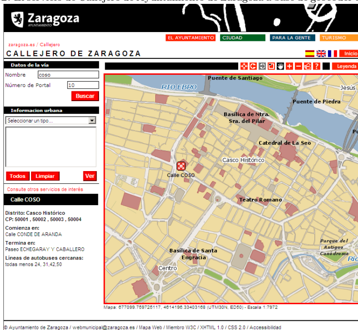
Figura 2: El servicio de Callejero de Ayuntamiento de Zaragoza a base de geocoder compuesto