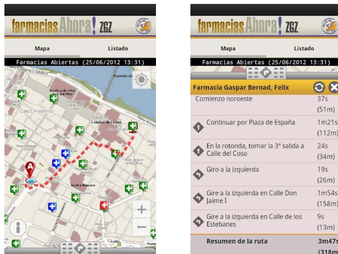
Figura 4. Cálculo de una ruta

la aplicación ofrece al usuario la posibilidad de calcular la ruta idónea para llegar a cualquiera de ellas, permitiéndole elegir si el desplazamiento se va a realizar en coche o andando. De este modo, una vez fijados origen (posición del usuario), destino (farmacia a la que se quiere llegar) y medio de transporte utilizado, la aplicación dibuja la ruta calculada, tal y como se muestra en la Figura 4 , junto con la descripción textual de la ruta en un panel desplegable diferente, ofreciendo el nombre de la vía por la que discurre cada tramo y el tiempo y la distancia acumulados hasta ese punto.