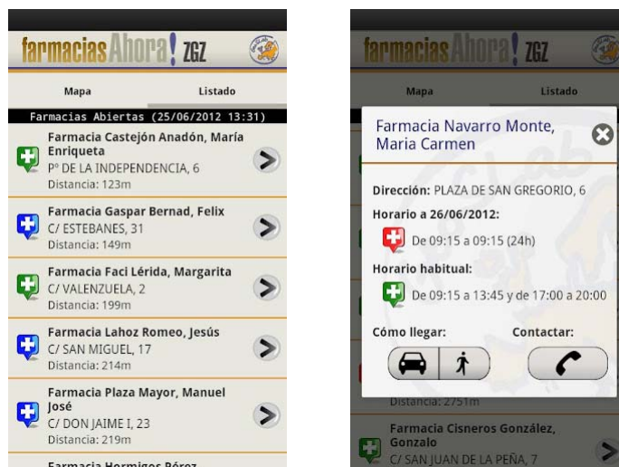
Figura 3. Listado de farmacias y detalle de una de ellas

Asimismo, se proporciona información útil de cada farmacia incluyendo su teléfono, dirección, horario actual y horario habitual, ofreciéndose la posibilidad de llamar directamente a cualquier farmacia desde la propia aplicación. Como utilidad adicional a la localización de farmacias cercanas,