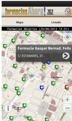
Figura 2. Pantalla principal de la aplicación